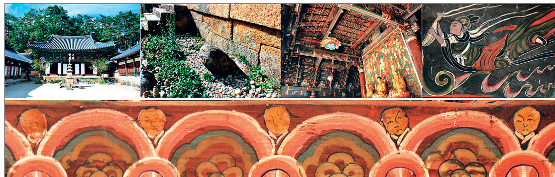
사진의 뒷줄은 대웅보전과 내부, 기단부의 돌거북, 비천벽화 등이고, 사진의 아랫줄은 천정에서 영기화생하는 희유의 장면이다.

화염의 꽃을 피우고 있다. 천정은 건축요소의 개념을 초월하여 생명력의 기가 충만한 우주적 필드, 거시적 장(場)으로 펼쳐졌다. 그 장은 서로 관계하며 소통하는 유기체적 세계일화(世界一花)다.