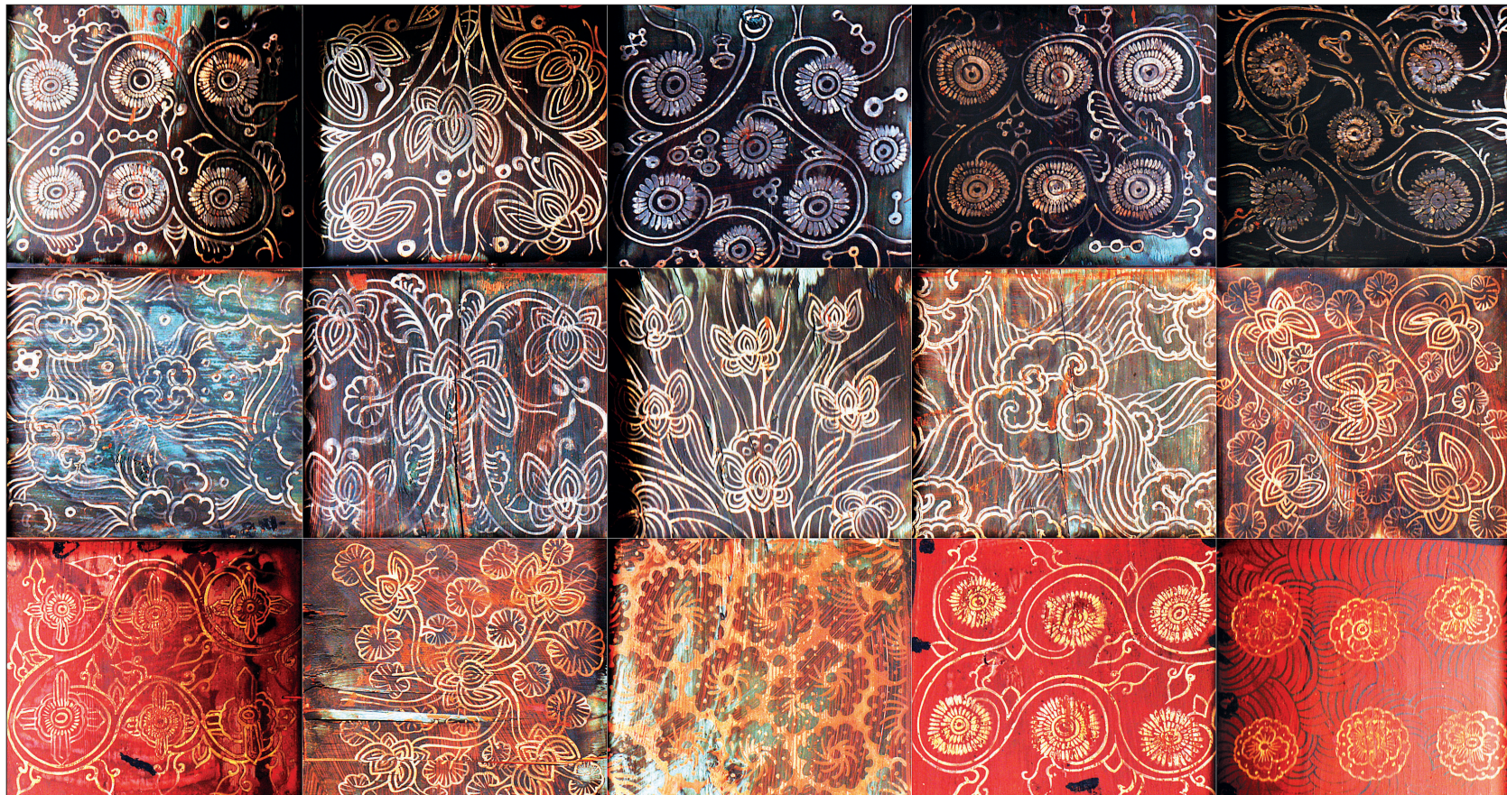
대웅보전 외진주 영역 천정에 장엄된 영기문과 천문별자리 문양이다. 좌우협칸 63칸에 장식된 氣와 별자리문양의 세계로 현묘하기 가없다.

대웅보전에 베풀어진 사신도 벽화는 엄격한 방위의 개념에서 자유롭다. 유가의 사회에서 도교적 요소를 흡수한 불교장엄을 고려하면 자유로움의 개념성이 충분하다. 장방, 대들보, 천정 등 불전 내부 곳곳에 용과 백호, 현무, 주작의 사신을 베풀었다. 단지