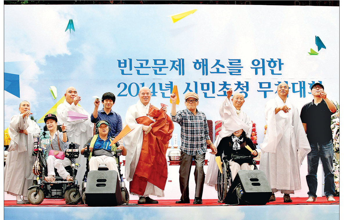
"가난한 이들도 장애인도 함께 살자" 조계종(총무원장 자승)은 9월 17일 서울 종로 조계사에서 '빈곤문제 해소를 위한 2014년 시민초청 무차대회'를 개최했다. 조계종 자승총무원장 자승 스님과 빈곤사회연대의 주관으로 진행된 이날 무차대회는 기초생활수급자, 장애인단체 회원, 쪽방주민, 홀리스타 학생, 빈곤층 어르신, 거리노숙자 등 300여 명이 참석했다. 글=신성민 기자

가윤, 손나은 등 19명이 위촉됐다. 홍보대사들은 위촉장을 수여받고, 응원 메시지를 전달하고 머그컵 사인 이벤트 등을 진행했다. 이덕화 씨는 "졸업한 지 40년이 지났지만, 행사 때마다 학교에서 불러주셔서 고맙다"며 "후배들과의 향기로운 만남이 자주 이어지길 바라며, 학교 발전을 위해 최선을 다해 돕겠다"고 소감을 전했다. 이들 홍보대사들은 다양한 활동을 통해 동국대 알리기에 나설 예정이다. 먼저 사인(sign) 머그컵을 축제 기간 동안 총학생회에서 개최하는 바자회를 통해 판매하고, 판매 수익금을 어려운 이웃돕기에 사용한다. 이와 함께 동국대는 10월 25일 오후 3시 교내 운동장에서 불사봉행대회를 열고 대대적인 모연에 나선다. 불사 증명은 조계종정 진제 스님을, 고문은 이사장 정연 스님과 조계종 총무원장 자승 스님 등을 위촉할 예정이다. 노덕현 기자