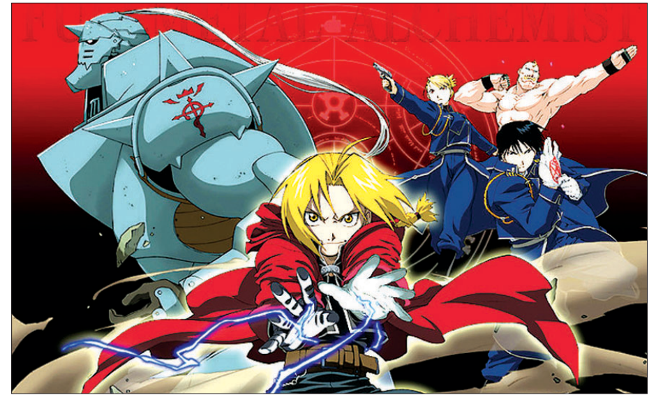
《강철의 연금술사》애니판 포스터. 《강철의 연금술사》는 연금술이라는 판타지에 생명과 죽음이라는 성찰을 가미했다.

이 같이 《강철의 연금술사》가 던지는 첫 질문은 '생명'과 '죽음'이다. '불로불사'와 '생명 창조'는 과거부터 지금까지 인간이 꿈꿔왔던 꿈이었고, 지금도 과학을 통해 이를 만들어 내려고 노력한다.