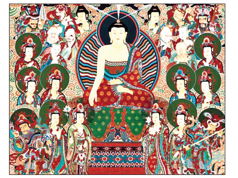
이수예 작가의 ‘연산화상도’

이밖에도 지장시왕도, 화엄신중도 등 불교회화의 대표적인 불화들을 한자리에 감상할 수 있다. 또한 기존에 볼 수 없