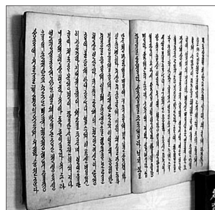
최초의 한글불교개론서 <불법총론>

함께 지정된 포천 왕산사 대해보각선사서는 송나라 임제종(중국 선종 5가의 한 파) 승려인 대해종고의 편지글을 모은 책이다.