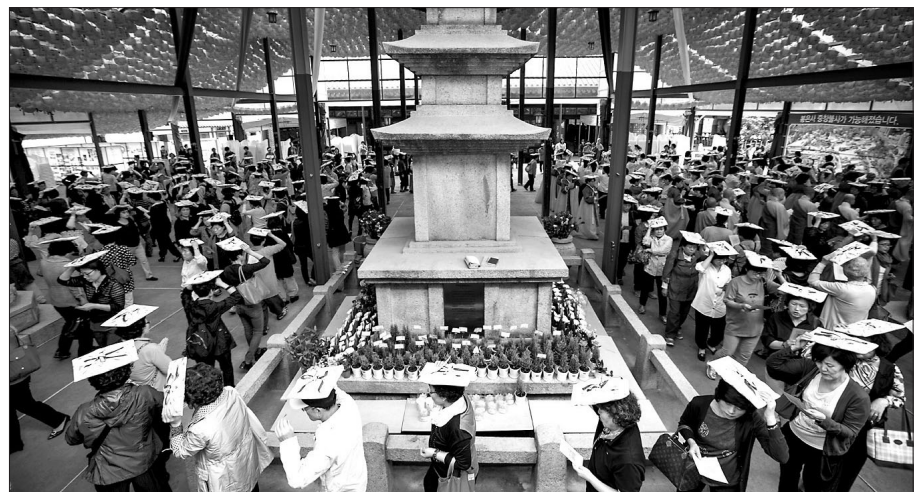
봉은사는 지난해 열린 개산대제에서 판전(版殿)에 소장된 주요 문화재인 화엄경판 인경본을 정대(頂戴)하고 봉은사전 도량과 법계도를 요점하는 '정대불사'를 거행했다.

해마다 9·10월 즈음이 돌아오면 전국 사찰에서 개산대제를 거행한다. 개산(開山)이란 보통 산에 터를 닦아 절을 세워 수행도량으로 삼는다는 말로, 사찰에서는 개산일에 개산대제(開山大齋)를 열어 절을 창건한 개산조 스님에게 예를 표하고 사상과 가르침을 되새긴다. 최근 들어 각 사찰에서 진행되는 개산대제는 전통적 행사에 머물지 않고 지역민들이 불교문화를 체험할 수 있도록 산사음악회, 전시회, 사생대회 등 다양한 문화행사를 열어 불교포교에 긍정적인 영향을 주고 있다. 올 가을에는 서울 봉은사(9월 21일~10월 5일), 양산 통도사(10월 1~5일), 울산 월봉사(10월 12일), 영천 은혜사(9월 27일), 부산 범어사(10월 3~4일) 등을 비롯한 전국 사찰에서 문화행사를 결연한 개산대제가 열린다.