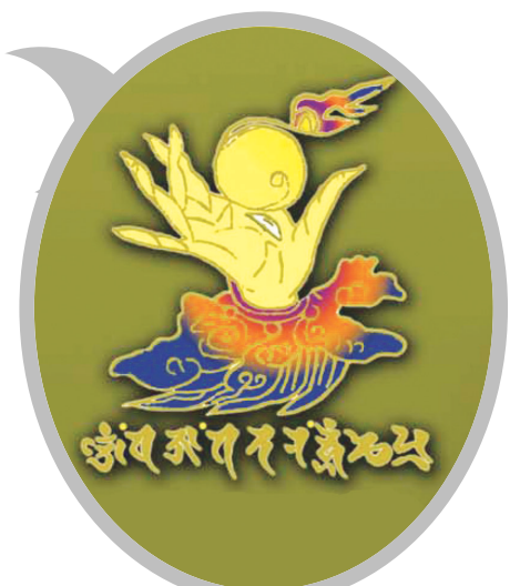
42수진언 족자 중의 '여의수주 진언' 확대사진