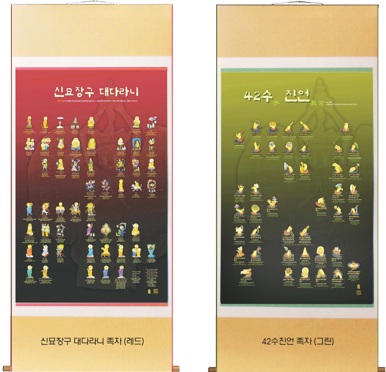
신묘장구 대다라니 족자 (레드)