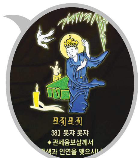
신묘장구 대다라니 족자 중의 '모자모자' 확대사진

범보시용으로 탁월하며 각 가정에 행운과 복을 선사합니다. 10개 이상 구매시 원하시는 문구를 새겨 드립니다.