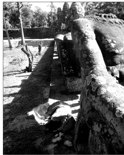
한국인 대학생이 캄보디아 앙코르와트에서 석상의 머리를 부수 논란이 됐다.