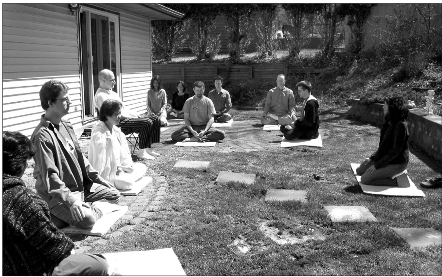
미국 뉴욕주 빙엄턴에서 큰 호응을 얻고 있는 ‘불교명상 동호회’ 회원들.

《Pressconnect》지는 “불자가 아니어도 명상이 삶에 도움이 될 것이라 생각하는 지역 주민 누구나 수요일 명상 클래스에 참