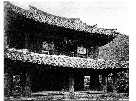
오대산 사고의 옛 모습

월정사 주지 정념도 '오대산 사고의 입지 배경과 사명당' 발표를 통해 "사명 대사는 월정사를 중창하고 스스로를 오대산인이라 칭했다"며 "오대산사고가 건립된 이후 주변은 금역으로 지정됐으며 이로 인해 승유역부의 파고를 넘어 월정사도 안정적인 발전을 보인 계기가 됐다"고 말했다.