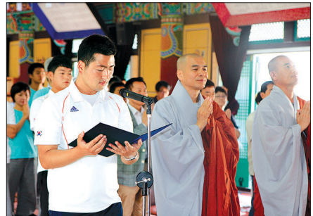
불자선수들은 선전기원법회에서 아시안게임에서의 선전을 빌원했다.

태릉선수촌 법당 주지 퇴휴스님은 “어제보다 오늘, 오늘보다 내일에 성장할 수 있다면 우리는 매일 성공한 삶을 사는 것”이라며 “자신이 행복과 성공의 업을 쌓으면 행복해지고 성공한다”고 강조했다.