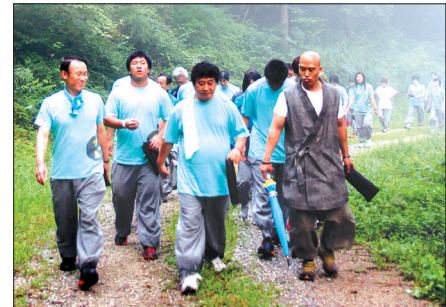
템플스테이 둘째날 아침 진행된 숲속걷기명상.

이어 “불자 선수 여러분에게 전 국민과 불자들은 응원과 환호를 보낼 것”이라며 “여러분이 맑은 절대 거짓말을 하지 않는다”고 격려했다.