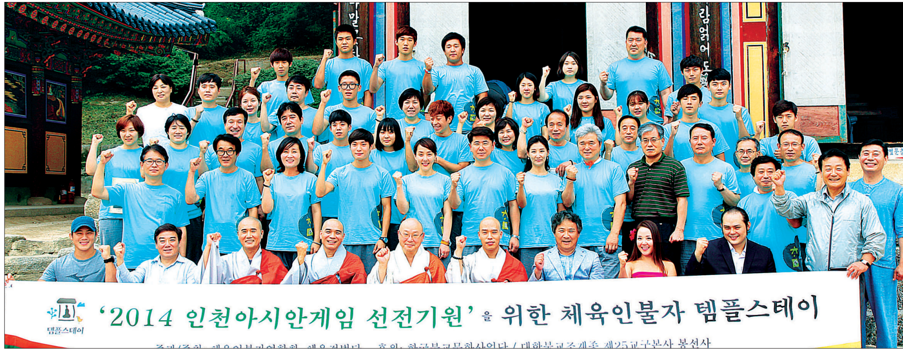
남양주 봉선사에서 열린 '2014인천아시안게임 선전 기원 템플스테이'에 참가한 불자선수들과 체육인불자연합회 관계자들이 경기에서의 선전을 기원하는 파이팅을 외치고 있다.