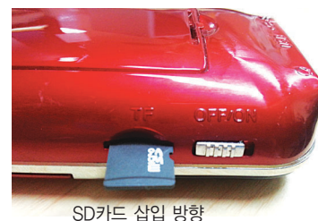
SD카드 삽입 방향

● 가격: 6만원 (배송비 포함) / 청색, 홍색 2컬러 * 스님들께서 불자들에게 드리는 선물로도 더욱 좋습니다. (100개 이상 구입 시 사찰명 별도 표기해 드립니다.)