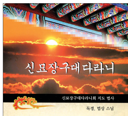
법상 스님의 독경에 음을 붙인 '신묘장구대다라니' 앨범표지

법화경 7만자 한글풀이 20장 CD로 '신묘장구대다라니'에 곡 붙이기도 예불음악 등 불교음반 40여 장 작업 퇴직 후 청년 위한 불음 포교 '발원'