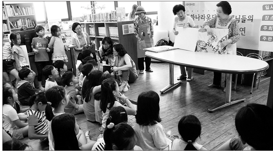
8월 20~22일 열린 신사어린이 도서관 축제에서 어린이들이 빅북으로 하는 동화구연을 관심있게 지켜보고 있다.