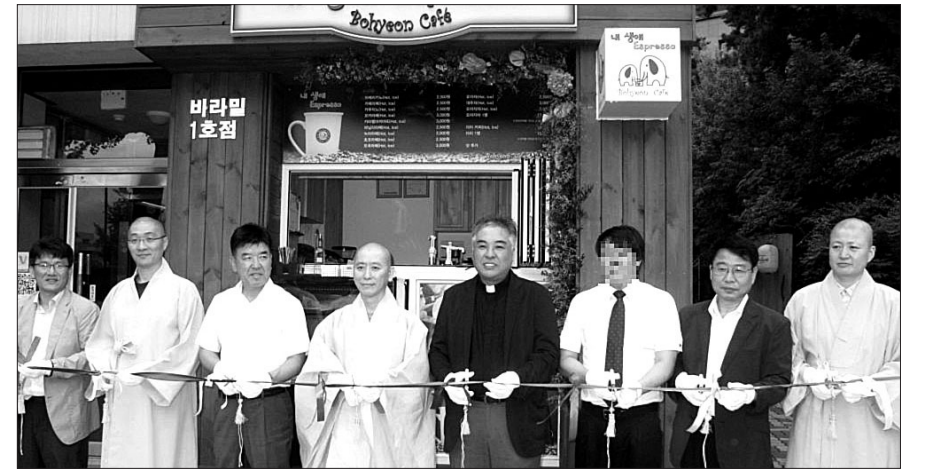
수송보현의집은 8월 18일 서울 종로구 수송동에 노숙인 자활 지원사업의 일환으로 '내 생애 에스프레소' 카페를 개설했다. 사진은 오픈식 당일 축하 내빈들의 모습.