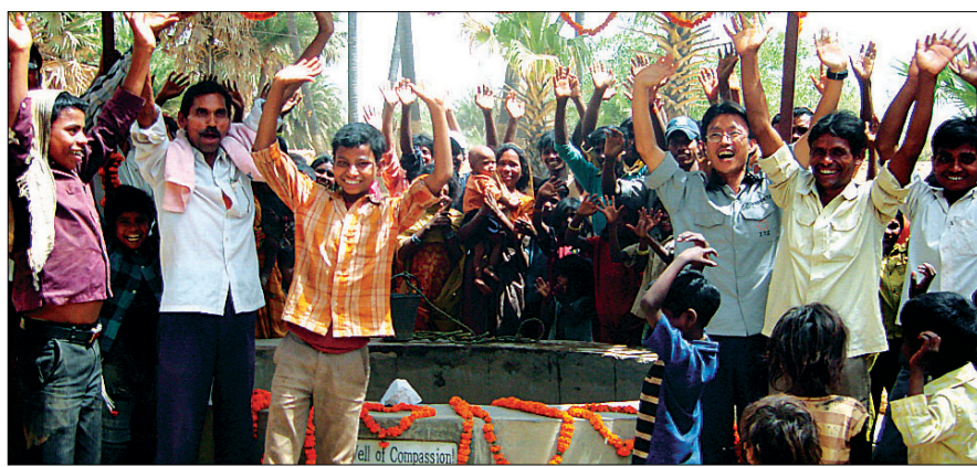
2010년 인도불가촉 천민지역 우물공사를 마치고 주민들과 함께 환호하고있다.

한데 좋은 일인지 생각하게 되었어요. 마음적으로는 스스로 우쭐해지고 일에 있어서는 매너리즘에 빠진 건 아닐까 돌아보게 되었죠.”