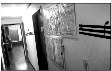
무의탁 노인들이 기거하는 '변영노인의 집'