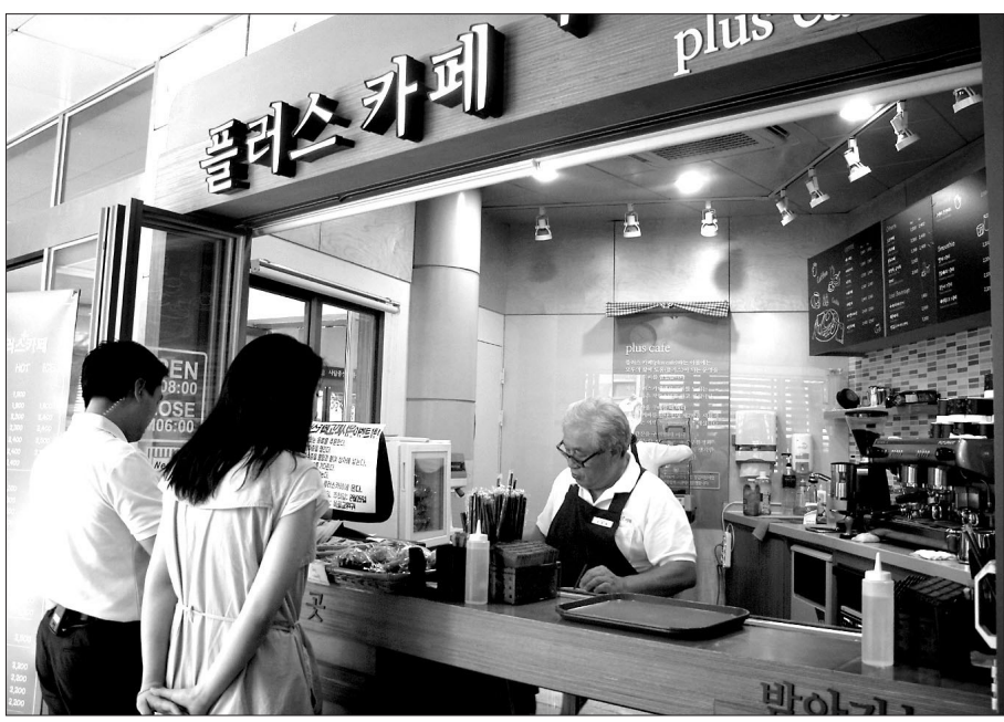
서울 종로구청내에 위치한 플러스 카페. 70대 어르신들이 바리스타로 있는 이곳은 지난해 매출 1억 4천여만원을 기록했다.

이처럼 노인일자리 사업은 어르신들의 경험과 연륜을 살려 시장경쟁력을 높이는 추세다. 타 사업과는 달리 이윤추구가 주된 목적이 아니기 때문에 소비자들의 상품 신뢰도 역시 높은 편이다. 저렴한 가격 또한 주요 경쟁력이다. 플러스카페 커피가격은