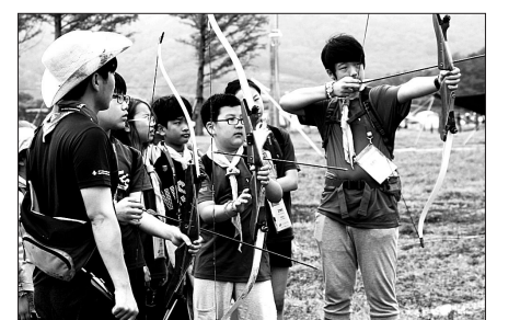
불교스카우트는 지난 8월 1~6일 경북 상주에서 열린 국제패트roller 멤버리에 참가해 다양한 프로그램으로 대자연속에서 몸과 마음을 단련했다.

간 중 '종교관'을 개설해 매일 아침 예불을 실시했으며 한국불교를 세계 청소년들에게 소개했다.