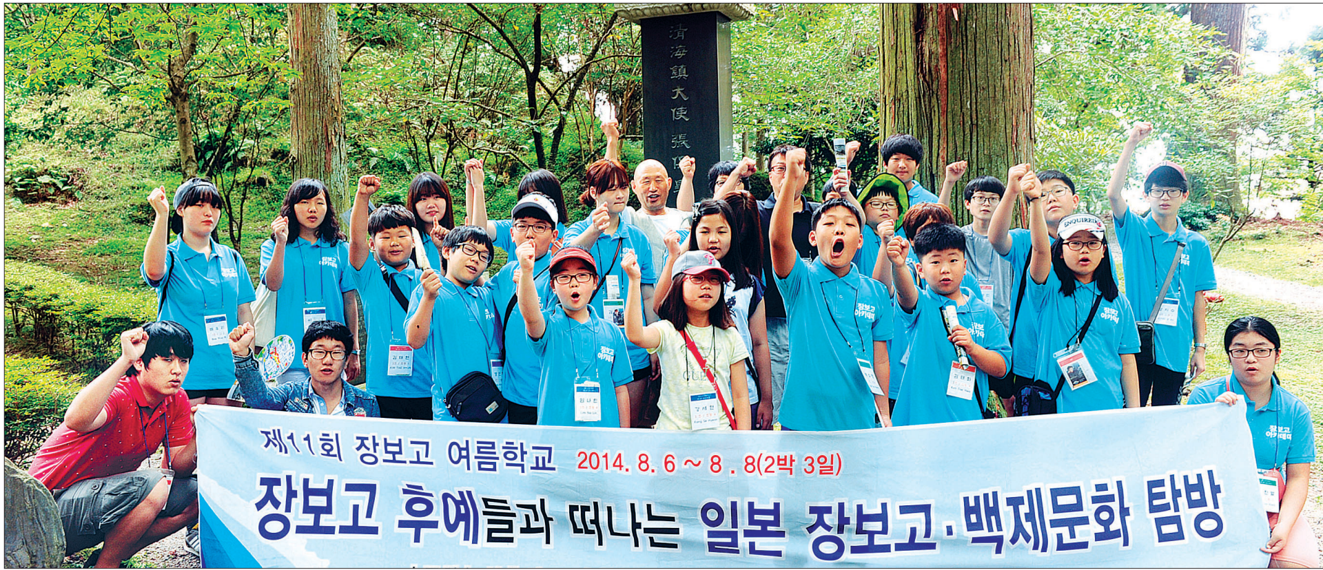
신라 장보고 대사가 해신으로 모셔져 있는 연력사에는 원도군이 기증한 장보고 대사 기념비가 세워져 있다. 아이들은 이 비석 앞에서 힘차게 파이팅을 외치고 있다.