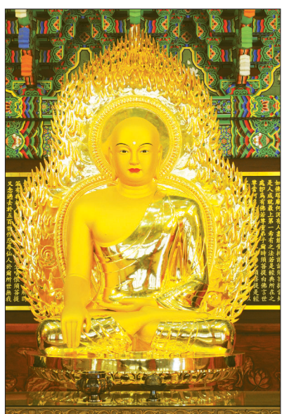
현지사 대적광전 비로자나불

우리나라의 안녕과 남북한간의 평화를 유지하고, 세계전쟁을 방지하는 인류 평화의 파수꾼