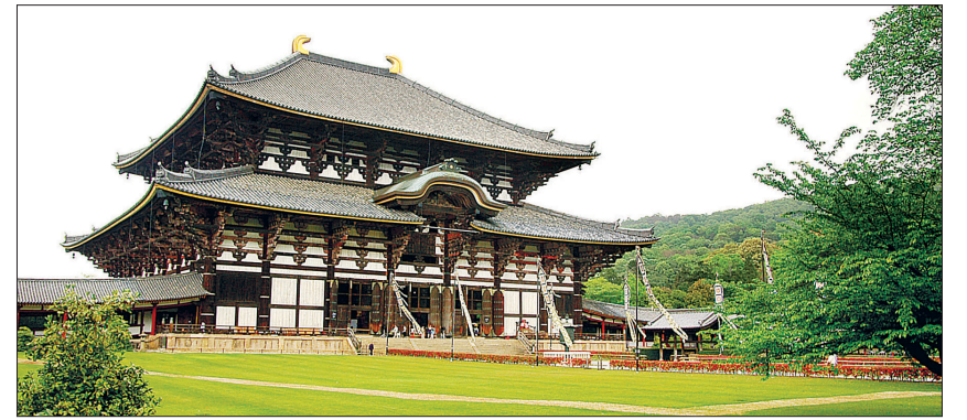
고구려, 백제, 신라 삼국의 합작품인 동대사