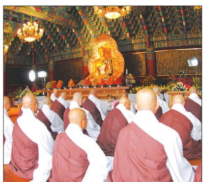
대적광전에서 부처님께 공양을 올리고있는 스님들

기존불교에서는 진여, 자성, 본래면목, 공을 증득하면 법신을 증득한다고 말합니다. 그러나 그렇지 않습니다. 기존불교의 법신은 자성광의 세계이지만 실제의 청정법신은 더 깊은 차원의 무량광의 세계입니다. 무량광은 자성광