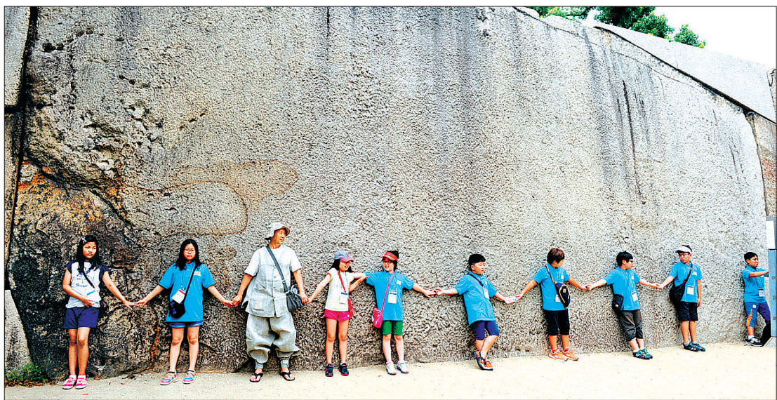
오사카성 앞에 놓인 130톤의 돌 앞에서 서로의 손을 맞잡고 기도를 올리는 답사단