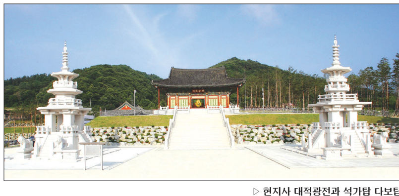
현지사 대적광전과 석가탑 다보탑

현지사 대적광전은 불교를 이룬 큰스님에 의해 점안되어 있습니다. 불교를 이룬 큰스님이 점안하면 이 비로자나불상은 삼정광세계에 있는 실제의 비로자나불과 무량광 빛으로 링크(연결)되어 필요한 경우는 상상을 초월하는 불력을 발휘하게 됩니다. 또 비로자나불이 모든 부처님의 법신을 총칭하고 있으므로 어떤 부처님이라도 이 비로자나불상을 통해 현지사에 현신하고 상주할 수 있게 됩니다. 다른 절의 대적광전은 점안이 되어 있지 않으므로 보신부처님이 상주할 수 없습니다. 특히 현지사 대적광전에 모셔진 이 비로자나불은 두 분 큰스님께서 우리나라 남북한의 평화적 통일과 세계 평화에 대한 간절한 발원이 성