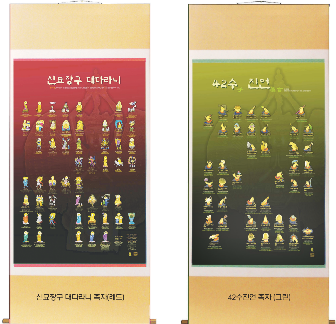
신묘장구 대다라니 족자(레드)