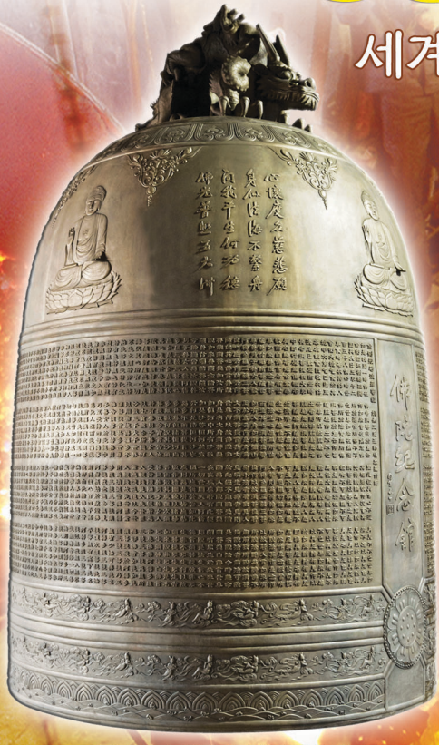
불광산사 범종 (중량 6700관)

최근 세계적인 범종 제작회사로 거듭나고 있는 성종사가 대만 최대 사찰인 불광산사 범종을 수주하는데 성공하였습니다. 대만 최대 규모인 6,700관 (25.5ton)으로 제작된 본 범종은 성종사 특허공법인 밀랍주조공법으로 제작되어 표면과 문양이 매우 매끄럽고 섬세할 뿐만 아니라, 음향측정 결과에서도 소리가 매우 웅장하고 맥놀이가 뚜렷하다는 극찬을 받았습니다.