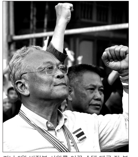
지난 5월 반정부 시위를 이끈 수텡 태국 전 부총리가 방콕에서 지지자들을 향해 손을 흔든다.

수텡 전 부총리는 쿠데타를 일으킨 프라웃 찬-오차 육군참모총장과 자신이 오