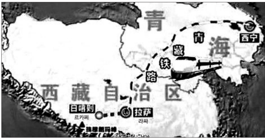
티베트 라싸에서 르카쩌를 연결하는 253킬로 구간이 8월에 개통된다. 또 2020년까지 인도 및 네팔 국경까지 확장하는 방안이 추진되고 있다.

중국은 인도와의 경제 협력 강화를 위해 중국-남아시아 간 철도 실코르도 건설을 희망해 왔으며, 이번 철도 건설은 중국과 인도 등 남아시아를 철도로 잇는 철의 실코르도 구상의 출발선이라는 관측이 나