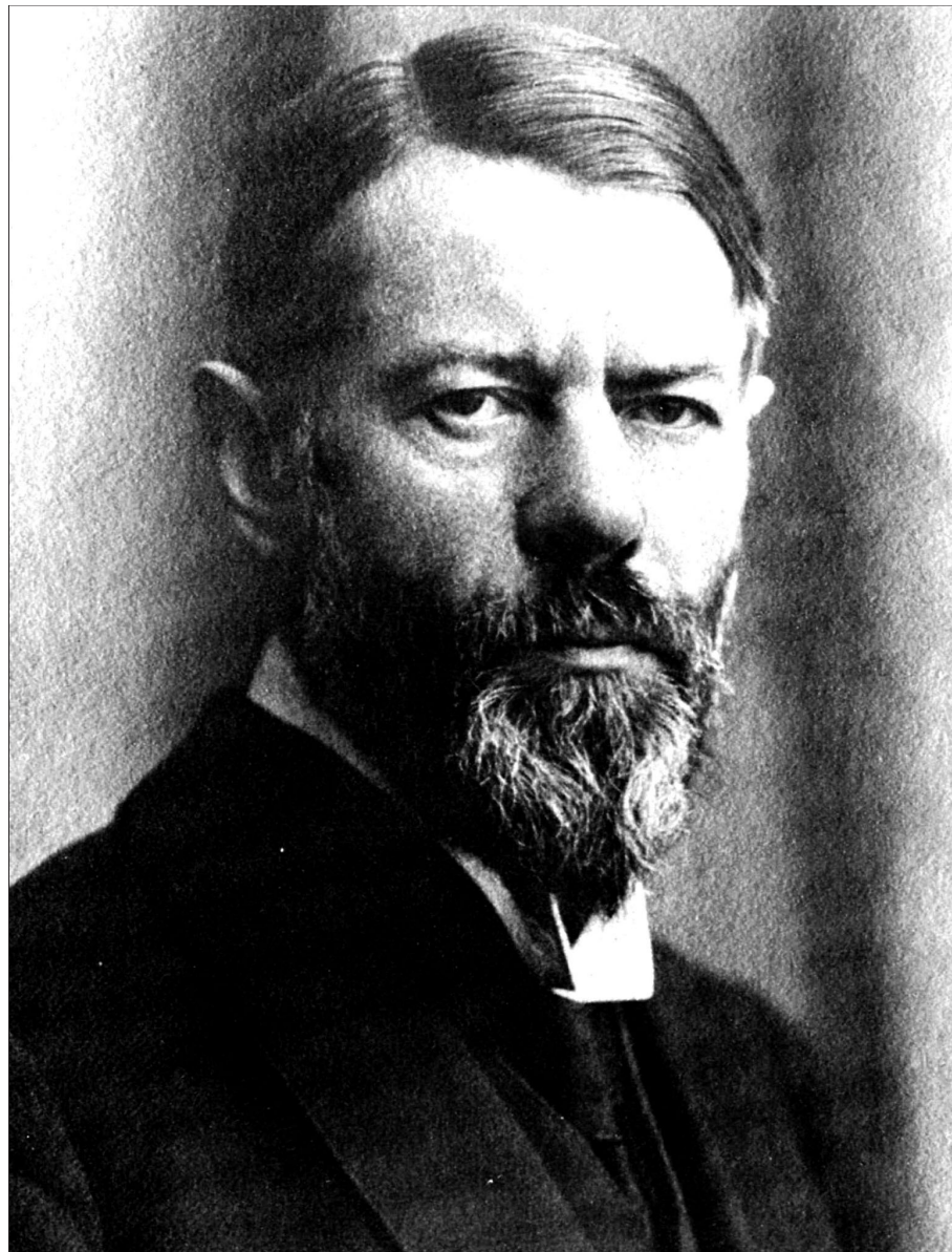
독일 근대사회학자 막스 베버(Max Weber, 1864~1920)의 모습. 그는 종교를 비롯한 다양한 분야를 사회학으로 연결한 지성이지만, 시대적 한계를 극복하지 못했다. 특히 서구의 근대적 합리성을 창출 하지 못한 이유를 동양의 종교성에서 찾았고, 이는 뿌리 깊은 오리엔탈리즘으로 이어졌다.

이러한 구원론으로 말미암아 불교에서 구원의 수단은 지혜일 수밖에 없다고 베버 는 지적한다. "불교에서도 구원은 지혜를 통해서 확보된다. 이것이 세속이나 천국의 일 혹은 사물(things)에 대한 폭넓은 지식 이란 의미가 아님은 물론이다. 오히려 그와