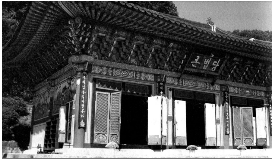
한글판역과 주련이 걸린 봉선사 큰법당. 최초의 대웅전 한글판역이다.

하지만 이런 역사적 문화적 가치에 비해 현판은 홀대를 받고 있는 것이 사실이다.