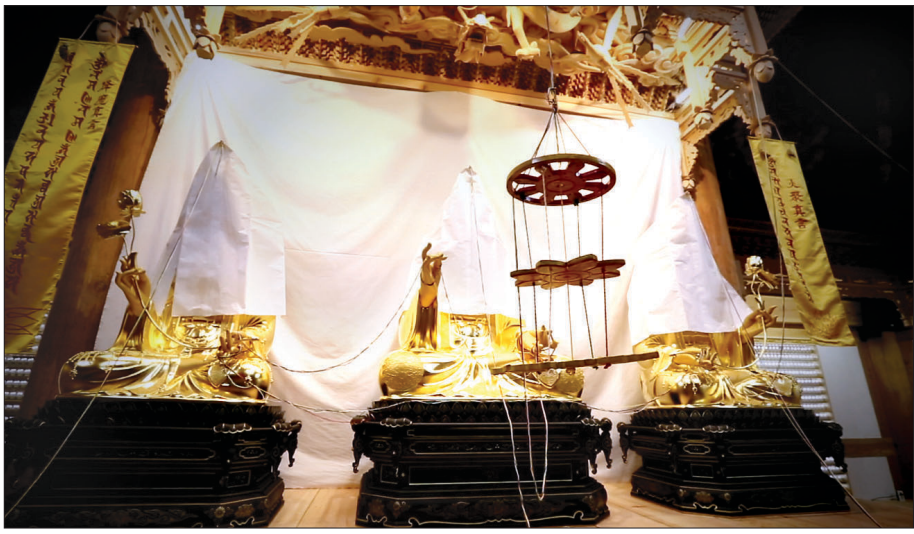
불복장 의식 전 과정을 담은 아리랑TV 다큐 '불복장, 불상에 역사를 담다'가 8월 6일 전파를 탔다.

불복장이란 점안될 불상의 내부 공간에 넣는 유물 또는 이를 넣는 의식을 가리킨다. 단순한 조형물에 지나지 않는 불상에 갖가지 문서와 곡식 등으로 부처님의 5장 6부를 만들어 넣어 생명, 신성(神性)을 불어 넣는 것으로 중국, 일본에서도 불복장 의식