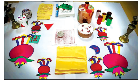
다양한 복장품을 정리하는 스님들(사진 위)과 진열된 복장품.

이 바로 불상 안에 들어 있던 복장품이었다. 뿐만 아니라 복장유물은 한국사를 연구하는 귀중한 사료가 되고 있는데, 경북 안동의 보광사의 목조관음보살좌상에서는 고려 인쇄술의 절정을 상징하는 1천여점의 목판인쇄물인 보현인다라니경이 발견되었고, 순천 송광사의 관세음보살상에서는 조