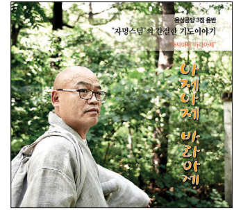
아제아제바라아제 앨범 표지