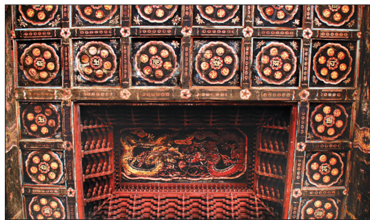
대웅전 불단 위에 경영한 감입형 보개천정. 위로 밀어올려 정엄한 단정이다.