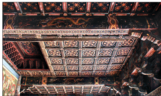
대웅전 천정은 여간과 양협간이 평평하게 조성됐다.