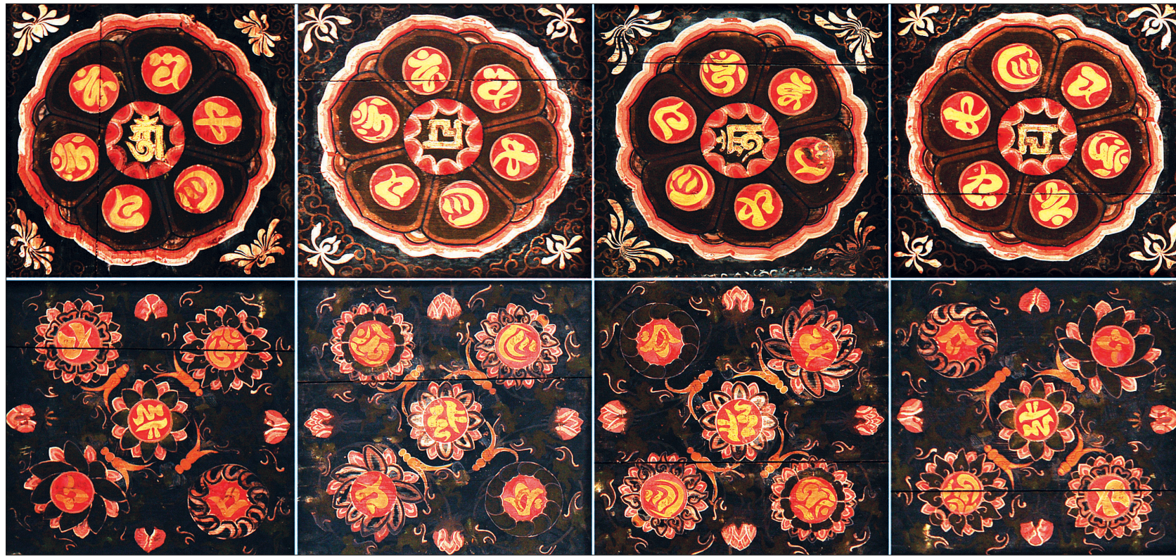
봉정사 대웅전 천정에 경영한 두 문양. 위의 문양은 여간의 것이고, 아래 문양은 양협간의 문양이다. 여간은 36간이며, 양협간의 우물간수는 55간이다.

봉정사 대웅전 천정은 여간과 양협간이 같은 높이로 평평하게 조성된 우물천정이다. 우물간 수는 여간에 36간, 양협간에 55간씩, 후불벽 뒤간에 12간 해서 총 158간이다. 후불벽 뒤간을 뺀 모든 우물간에는 법어로 ‘옴 마니 반메 훔’의 육자진언을 넣었다. 그런데 여간과 양협간에 넣은 문양이 서로 다르다. 두 문양 모두는 태극기의 조형원리를 닮았다. 태극과 건곤감리 사괘 자리에 고도로 관념화 된 연꽃문양을 배열했다. 우선 여간의 문양은 원원지방을 상