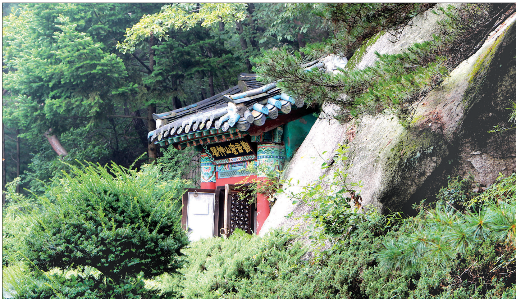
심곡암 관음굴 옆의 바위가 '물개바위' 혹은 '관음바위'로 불리는 신령스런 바위이다. 기도 후 아들을 낳았다는 설화가 전해지며, 이 곳에는 아직도 많은 이들이 기도를 올리고 있다.

그 곳은 길도 없고 곳곳이 칠푼돌에 뒤덮혀 자주 맹수가 나타나는 곳이었다. 김참판의 부인은 험한 길을 마다하지 않고 산길을 올랐고, 물개바위를 찾아 지극한 마음으로 기도를 올렸다. 김참판의 부인