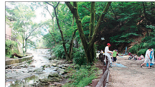
정릉 청수장 유원지

정릉계곡은 오랜 옛날부터 청수동의 계류를 따라 형성된 계곡으로 여름철이면 피서를 위해 찾어드는 인파가 길을 메웠다고 한다. 특히 정릉유원지 깊은 곳에 위치한 청수장은 장안의 부호들이 즐겨찾는 장소였다. 청수장이라는 명칭은 삼각산 남측의 깊은 계곡의 맑은 물과 산수가 조화를 이룬 곳이란 의미다. 청수장은 현재 국립공원관리공단이 매입해 삼각산 탐방안내소로 사용하고 있다.