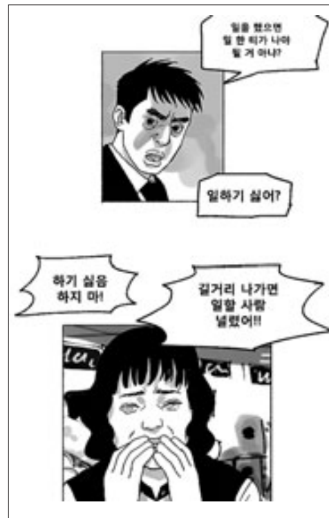
만화가 최규석의 첫 웹툰 <송곳>의 한 장면들. 노동 문제를 통해 대표적 대한민국 사회 저변에 깔려있는 부조리를 이야기한다.

"지방대는 저희 학교보다 대학서열이 낮아도 한참 낮은 곳인데, 제가 그쪽 학교의 학생들과 같은 급으로 취급을 받는 건 말이 안 되지."