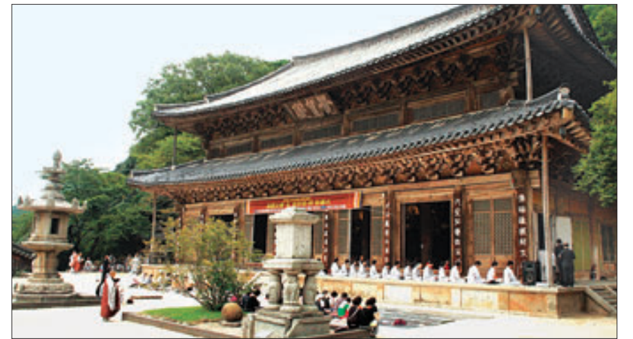
화엄사의 중심공간 각황전(국보제 67호)