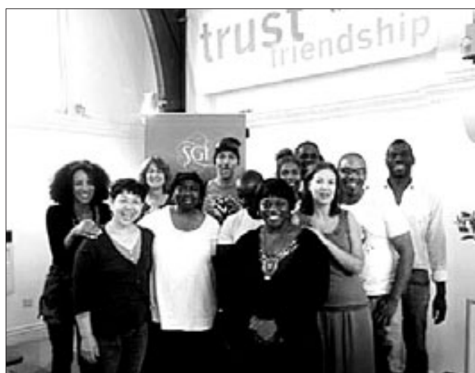
브릭스톤 불교센터의 '리더십 프로그램'에 참여한 흑인 불자들은 주중 프로그램 외에도 자발적으로 주말 워크숍을 진행, 신심을 다지고 있다. 사진 오른쪽은 명상에 참여하고 있는 다양한 인종의 사람들(자료사진)

〈The Voice〉지에 따르면 리더십 프로그램에 참여한 흑인들은 일상적인 문제부터 신앙적인 문제까지 다양한 주제의 토론을 하면서 자긍심을 키우고, 나아가 브릭스톤 사회에 긍정적인 변화를 꾀하기 위한 방법까지도 고민하는 한편 바자회나 문화 공연 등을 공동 기획·진행하며, 지역 사회에서 자신들의 입지를 넓히는 데에도 노력하고 있다.