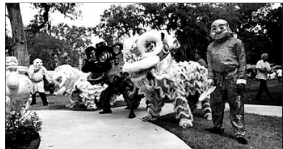
사바나 불교사원의 재가불자들이 조지아 주에서 처음 선보일 부란 축제 준비에 한창이다.