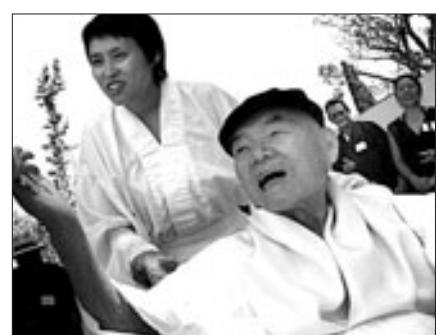
조슈 사사키(Joshu Sasaki) 스님의 생전 모습

1962년 도미, Mount Baldy Zen Center를 창립한 뒤 50여 년 동안 LA 지역에서 선불교의 가르침을 전해 왔던 조슈 사사키 스님은 LA 시더스 시나이(Cedars-Sinai) 병원에서 급성 패혈증으로 세상을 떠났다.