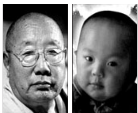
2009년 입적한 제3대 페룰 린포체(왼쪽)와 환생했다는 제4대 페룰 린포체(오른쪽)

환생을 믿는 중국 티베트인 거주지역에 3살 된 ‘환생 고승’이 거대 중파의 중정에 취임했다.