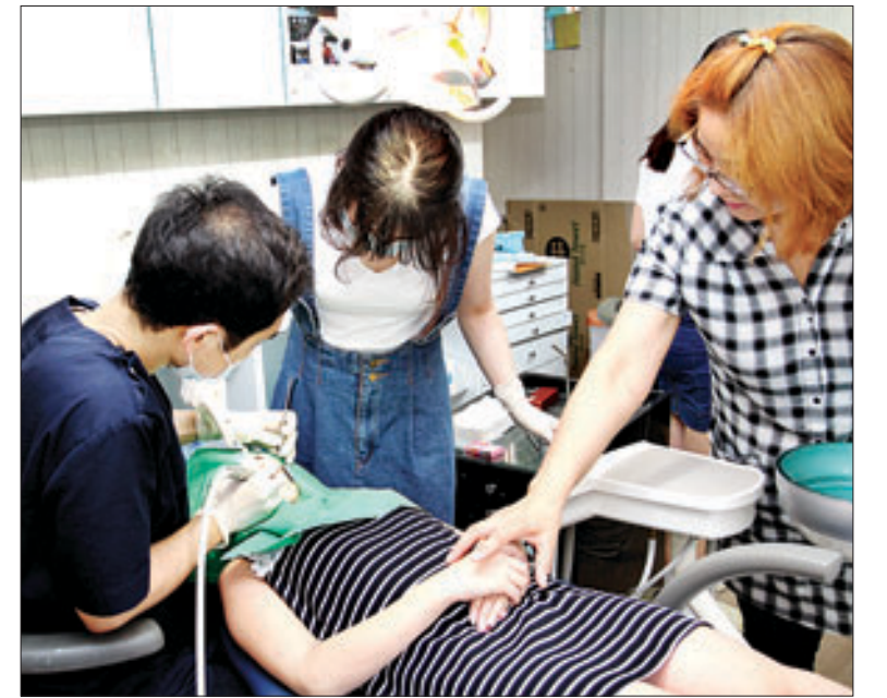
다인치과 직원들의 무료 진료 모습.