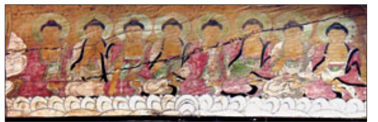
▲향우측 대량에 배운 천불부처. 연보라빛과 옥빛의 색상이 다정다감하다.

행과 열 정형속에 구현한 만다라 천불 부처님은 대웅보전 대들보와 사방 공포 위 벽