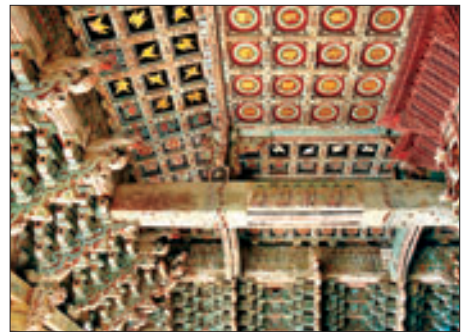
◀빛반자로 구현한 공룡형 천정과 천불도

◀미황사 대웅보전 천정문양을 재배열한 사진. 첫 행의 학에 입힌 금니기술은 연금술을 연상하고, 둘째 행에 나오는 연꽃문양의 변화는 '개(開)→시(示)→오(悟)→입(入)'의 일승법의 원리를 보여준다. 셋째 행은 천정의 중앙칸에 장엄된 범자문양 30칸 중 부분이다.