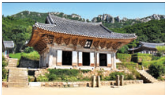
달마산 미황사 대웅보전 전경.