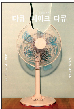
선풍기 영화제 포스터

한여름 에어컨이 아닌 선풍기를 틀어 놓고 영화를 보면서 환경도 지키는 일석이조의 행사가 마련됐다.