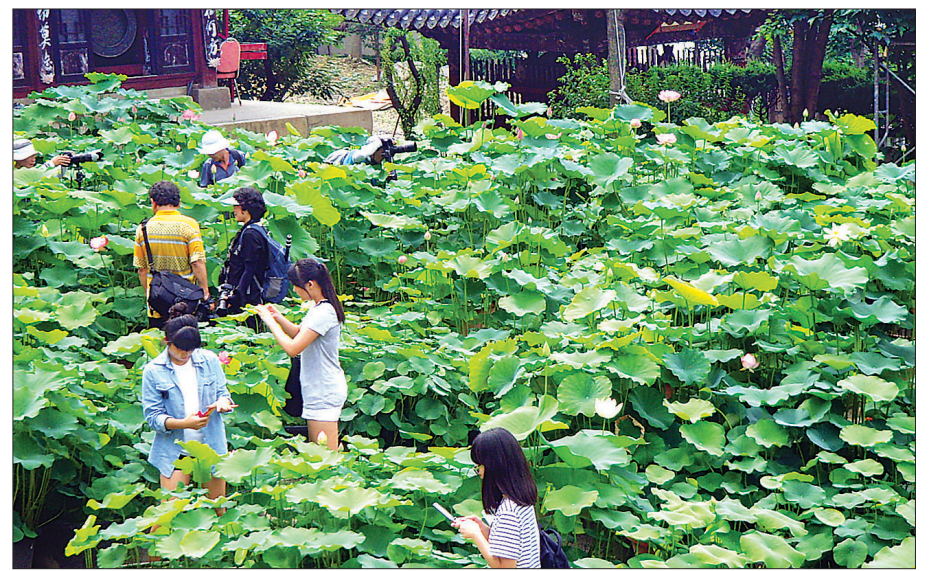
전국에는 지금 연꽃 축제가 한창이다. 사진은 지난해 신촌 봉원사 서울연꽃 문화축제, 올해는 8월 17일~23일신촌 봉원사 경내에서 열린다.

봉원사 서울연꽃 문화축제는 도심 한복판에서 연꽃 축제를 만날 수 있는 좋은 기회가 될 것이다. 8월 17일~23일 신촌 봉원사 경내에서 열리는 이 행사에서는 연꽃을 배경으로 시민과 함께하는 산사음악회와 페이스페인팅, 캐리커처, 한지공예, 도자기 만들기 체험, 민화전시 등을 만날 수 있다. 특히, 8월 23일 시민들과 함께하는 산사음악회에는 가수 오승근, 국악인 남상일, 국립국악원단원, 국립무용단원 등이 출연해 흥겨움을 더할 예정이다.