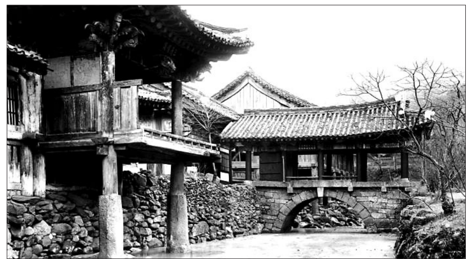
국립나주박물관은 2014년도 테마전시로 '유리건판 사진으로 보는 남도 사찰의 옛 모습'을 개최한다. 사진은 순천 송광사 우회각의 옛 모습.

중앙박물관 소장 유리건판 사진 중에는 1910년~1936년에 걸쳐 전라남도 지역에서 조사하였던 사찰과 문화재들의 자료가 남아 있다. 송광사, 화엄사, 선암사, 백암사, 대흥사와 같은 주요사찰의 건축물과 석조문화재는 물론, 도감사, 불갑사, 쌍봉사,