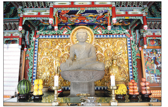
대웅전 내부에 모셔진 보물600호인 석조약사여래좌상