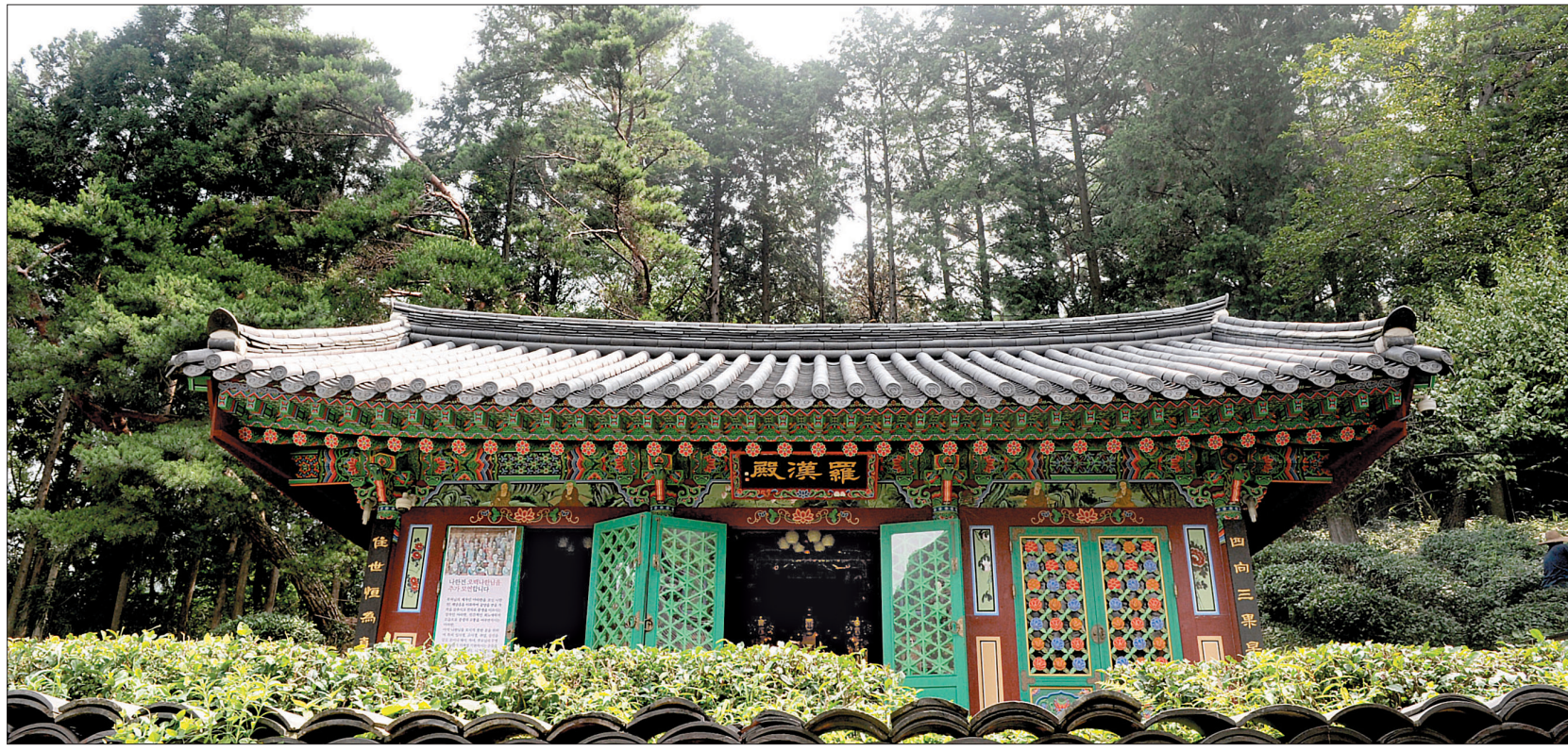
약사암 나한전 전경. 약사암은 한국전쟁 때에도 피해를 입지 않아, 옛 정취를 그대로 간직하고 있다. 주변경관과 함께 문화재로서의 가치도 상당하다.

약사암 법당에는 신라 하대인 9세기에 만들어진 석조여래좌상이 안치되어 있다. 질병에 빠진 모든 중생을 구제한다는 약사불은 중생들에겐 가장 필요한 부처의 모습이다. 통일신라 후기에 조성된 것으로 추정되는 석조여래좌상은 본존불과 대좌가 일체형으로 조성되어, 불상과 대좌를 포함해 226cm에 이른다. 8각 연꽃무늬 대좌에 앉으신, 유난히 넓은 무릎의 이 약사불은 천 년이 넘는 기나긴 세월 동안 얼마나 많은 중생의 기원을 들었을까?