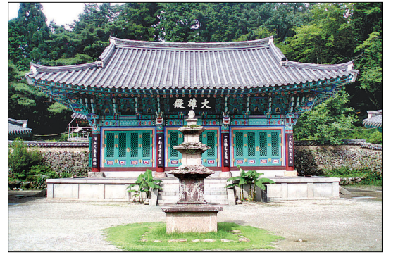
대웅전 앞 3층석담. 무너진 탑재를 모아 복원한 것이다.