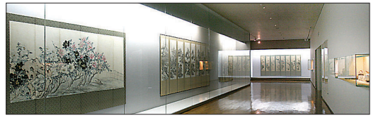
의재미술관 내부 전경

그 앞에는 의재 선생의 숨결이 그대로 느껴지는 춘설현과 의재묘소 등이 있다.