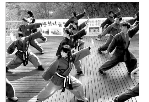
선무도는 1700년 된 한국전통의 심신 수련법으로 심신안정과 피로회복, 집중력 향상 및 다이어트에 좋다.

자우 스님은 "선무도는 1700년 된 한국 전통의 심신 수련법으로 심신안정과 피로