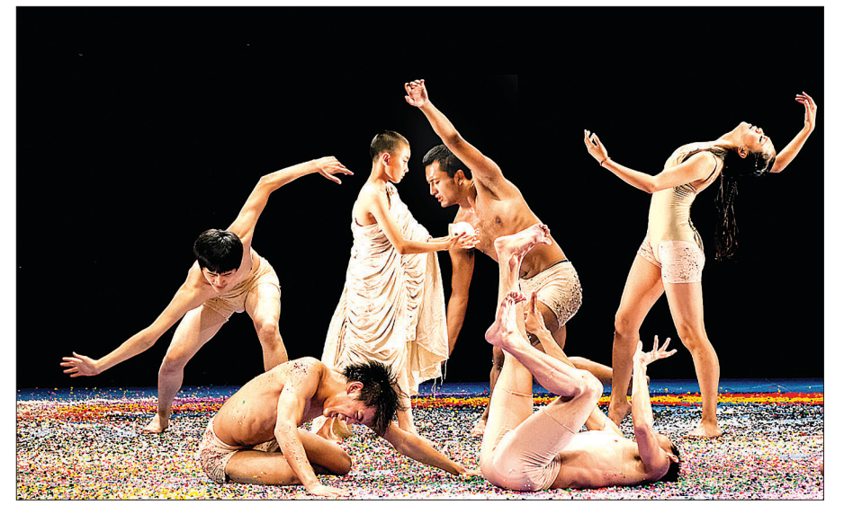
삼발라는 티베트의 민속춤 토포무와 티베트 불교의 금강무를 현대무용과의 조화로 이뤄낸 공연으로 공사상을 보여준다.

티베트의 만다라가 무대 위 춤사위로 그려지면 삶과 죽음을 넘어선 영혼의 여정이 펼쳐진다. 중국에서 활동하고 있는 티베트 안무가이자 연출가인 완마 지안추오(Wanma Jiancuo)는 '삼발라(Shambhala)'로 티베트 불교의 핵심과 티베트 문화의 정수를 무대 위에서 펼친다.