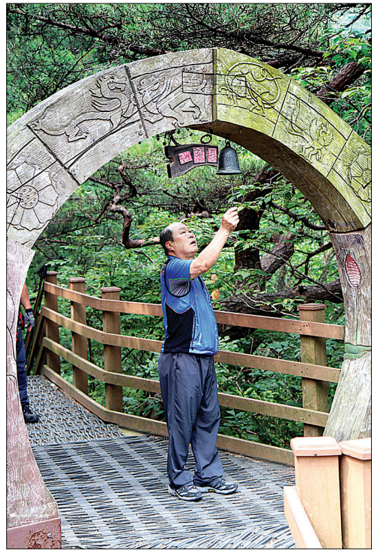
속리교를 지나 108계단을 오르면 해탈문이 나온다. 종을 치면 마치 고된 산행에서 해탈되는 듯 하다.