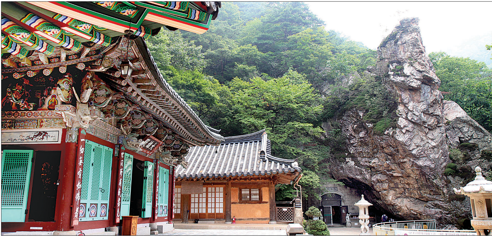
소요산 중턱에 위치한 자재암 전경. 우측에 보이는 바위굴이 바로 '원효샘'이 있는 나한전이다. 대웅전에는 <반아바라밀다심경약소>가 모셔져 있다. 나한전 우측으로는 작은 폭포와 계곡이 있어 도량 전체에 청량감을 준다.