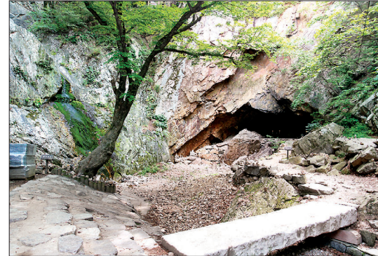
원효 스님이 정진했다는 원효굴과 원효폭포.