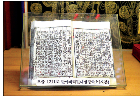
자재암 대웅전에 모셔진 <반아바라밀다심경약소>