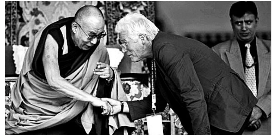
리처드 기어는 달라이 라마의 79번째 생일을 기념해 열린 법회에 참석했다.

리처드 기어가 달라이 라마를 만났다. 미국 연예매체 스플래쉬닷컴은 7월 6일 (현지시간) 할리우드 배우 리처드 기어가 티베트의 정신적 지도자 달라이 라마를 만났다고 보도했다.