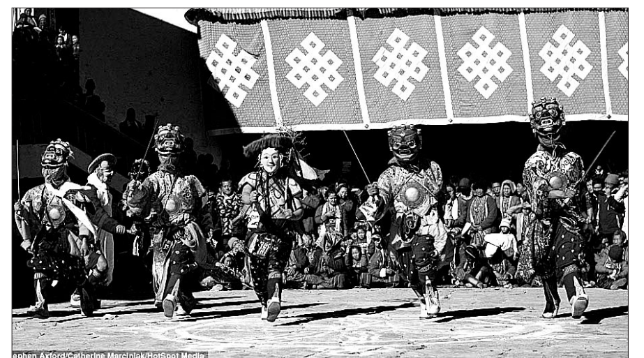
인도 타왕(Tawang)에서 티베트 불교 특유의 화려한 춤과 연극 등을 선보이는 토르가(Trogya) 축제가 3일간 열렸다고 (Mail online) 지가 보도했다.

타왕은 인도의 북동부, 아루나찰 프라데시 주에 속한 곳으로 해발고도 3,500m 높이에 위치하며 유서 깊은 티베트 불교문화와 소수민족의 전통이 어우러진 곳이다.