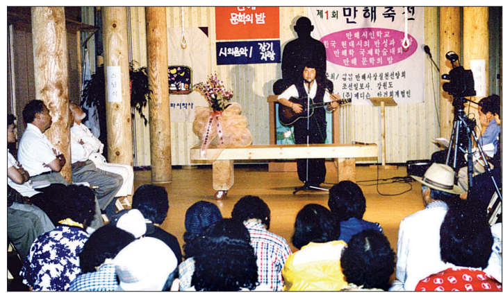
전국 어디든 부르면서 그는 노래하러 간다. 1999년 만해축전 초청공연.

자연히 그들과 불교 이야기를 나누기도 한다. 생각을 일으키는 것과 본디 마음의 차이에 대해, 화의 덧없음에 대해 의견을 주고받는다. 음악에 기대 진지하게 서로의 속내를 이야기하는 시간이 그들에게 더없이 후련했을 터다. 출소를 앞둔 재소자들은 그에게 그간 고마웠다면 손