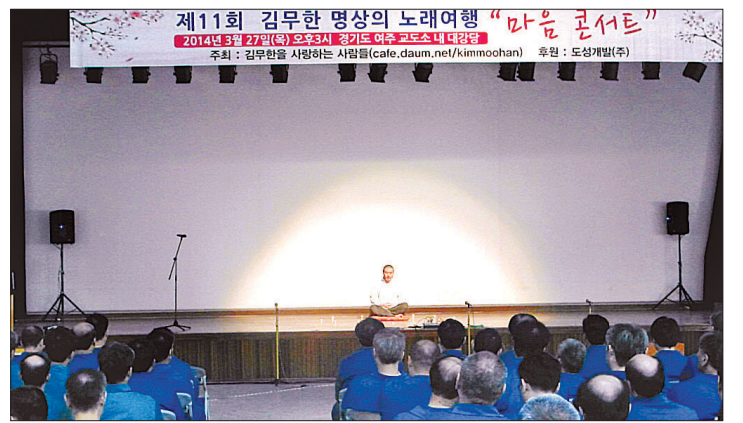
여주교도소에서 재소자들을 위해 명상을 가르치고 불음을 들려준다.

편지를 쥐어주기도 한다. 선생님하고 지내면서 바르게 살아야겠다는 생각을 하게 되었고 그 이유에 대해서도 충분히 알게 됐다는 내용이 대다수다.