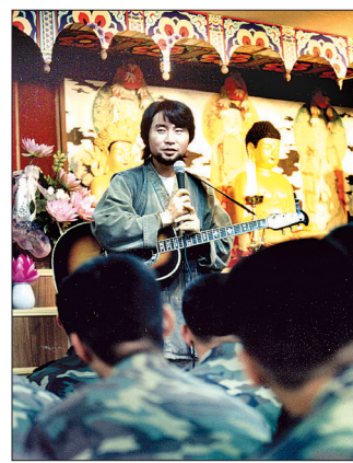
군법당에서 노래포교 하는 모습.