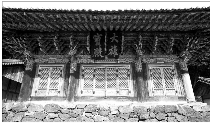
강진 백련사 전경. 고려시대 요세 스님의 백련결사가 이뤄진 곳이다.