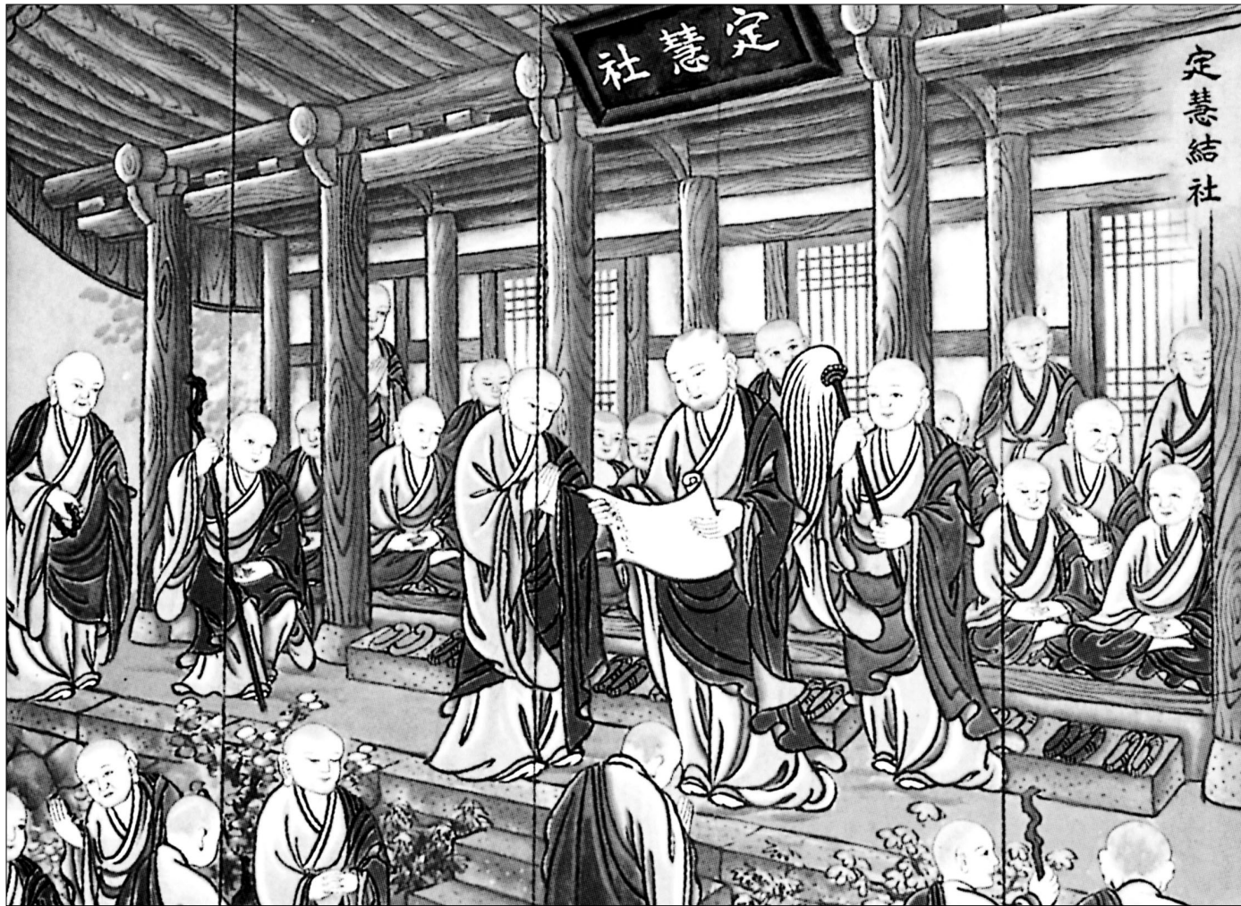
승광사 승보전에 그려진 벽화. 보조 지눌국사가 정혜결사문을 낭독하고 있는 모습을 묘사하고 있다.

"개경 보제사의 담선법회에서 도만 10여 명과 약속하기를 법회가 끝나면 마땅히 명리(名利)를 버리고 산림에 은둔하여 함께 결사하여, 인제나 선정을 닦고 정혜를 가지런히 함에 힘쓰고, 예불하고 정을 잃으며 노동하고 운력하는 데 이르기까지 각기 소임을 나눠 일을 하자. 인연에 따라 심성을 수양해