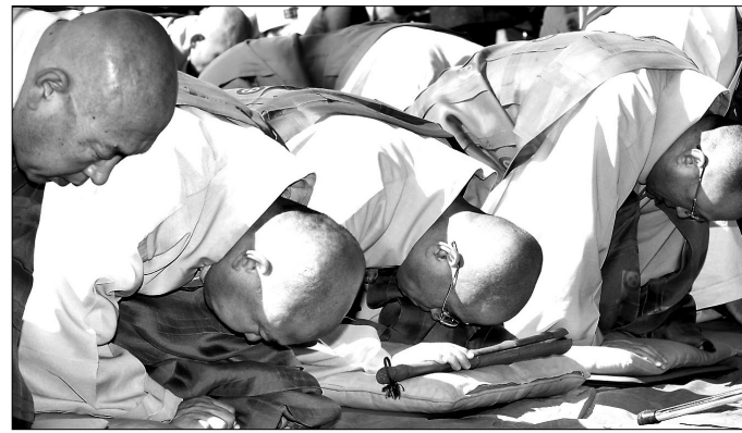
2011년 조계사 대웅전 앞에서 참회의 절을 올리고 있는 당시 조계종 집행부 스님들. 이는 자성과 쇄신결사로 이어졌다.

한 평생을 구속 없이 지내 달사(達士)와 진인(眞人)의 높은 수행을 따른다면 어찌 상쾌하지 않겠는가."