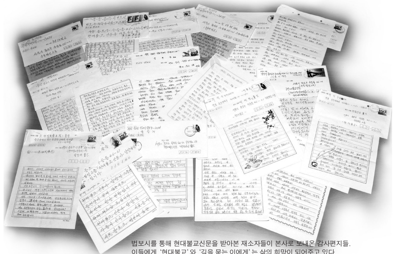
범보시를 통해 현대불교신문을 받아본 재소자들이 본사로 보내온 감사편지들. 이들에게 ‘현대불교’와 ‘길을 묻는 이에게’는 삶의 희망이 되어주고 있다.