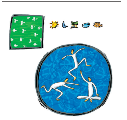
1000호를 기념해 최주현 삽화가가 보내온 그림들. 왼쪽 그림은 오랫동안 ‘길을 묻는 이에게’ 삽화를 연재해온 작가의 모습을 표현한 것이다. 오른쪽 그림은 자유롭게 여러 가지를 표현한 것으로, 최 화백은 “실명을 듣기보다 각자 개인이 그림을 보며 느낌을 가져봤으면 좋겠다”고 말했다.