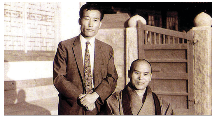
1970년 해안사 백련암에서 성철 스님과 함께

또한 그는 조계종 5대 종정 효봉 스님의 입적 당시 법구(法龜)라는 말을 최초로 고안해 내기도 한다. “당시 스님께서 입적하셨을 때 스님의 시신을 무엇이라 불러야