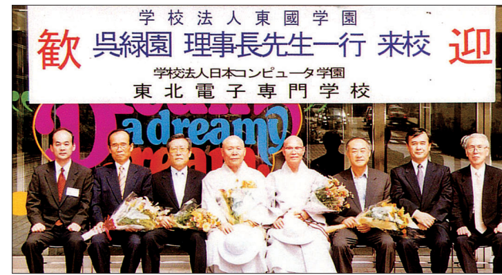
동대 전산원 원장으로 이사장 일행과 자매교인 일본 동북전자 전문학교 방문