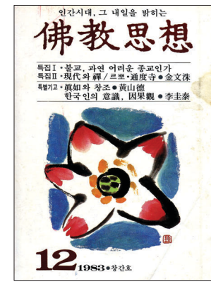
월간지 '불교사상' 창간호 표지