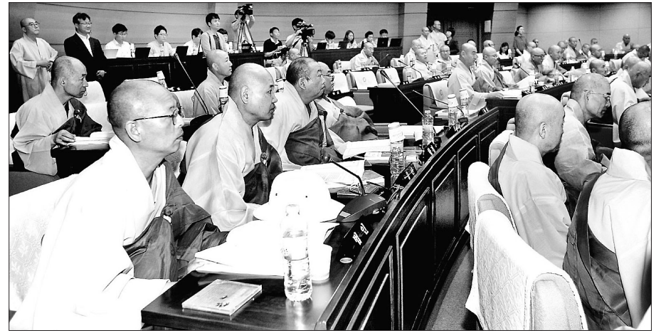
조계종 중앙총회는 6월 25일 제198차 임시회를 열고 종헌, 종법 개정안 등을 논의했다.

선학원과 별다른 대화 없이 만든 완화 조항이 얼마나 실효성이 있을지도 의문이다. 법인관리법은 선학원에 대해서는 이사 자격은 조계종 승려로, 이사 1/4 이상을 총무원장의 복수 추천에 의한 이사회 선출로 규정했다. 분명 이전 법인법과는 눈에 띄는