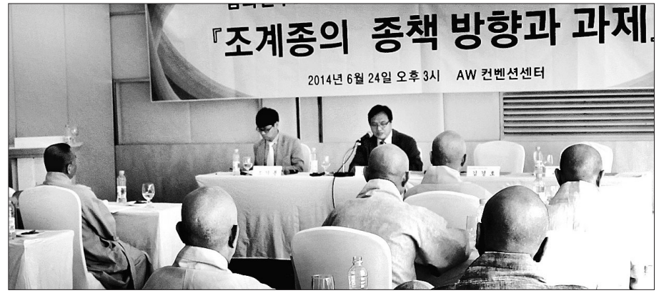
조계종 종책모임 삼화도량 삼화연구소는 6월 24일 첫 종책세미나를 개최하고 조계종의 종책 방향을 점검했다.

또한 총회의원 스님들이 대부분 일선 사찰 주지를 겸직하고 있는 상황에서 전문적인 종책 개발에 오롯이 힘을 쏟기가 어려운 것도 한계로 지적됐다. 김 교수는 “총회의