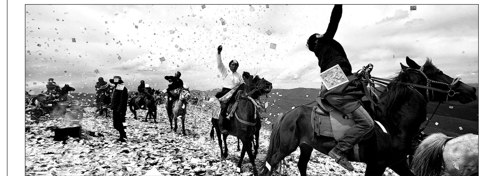
티베트 전통 축제 ‘웨이 상 페스티벌’ 중국 쓰촨성 아바장족자치주 흥위안에서 6월 18일(현지시간) 티베트 전통 축제인 ‘웨이 상 페스티벌(wei sang festival)’이 열렸다. 티베트인들이 말을 타고 달리며 공중에 ‘롱다(longda)’를 뿌리고 있다. ‘롱다’는 기도 문구가 적힌 종이 조각을 뜻한다. 매년 5월 혹은 6월 열리는 이 축제 때 티베트인들은 사이프러스 나뭇가지를 태우고 더 나은 삶과 풍년, 평화를 기원하며 기도문을 뿌린다. 이나은 기자