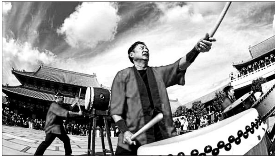
북미에서 가장 큰 사찰인 서러사는 개원 25주년을 맞아 올 한 해 동안 다양한 행사와 전시, 공연 등을 선보이며 대중의 눈길을 사로잡고 있다.