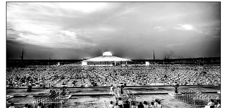
태국 방콕의 랜드마크 사원인 담마카야(Dharmakaya) 사원