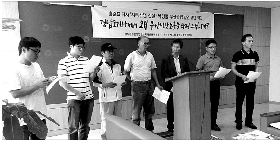
지리산 종교연대 등의 시민단체 활동가들이 6월 18일 경남도청에서 기자회견을 열었다.

사천지역 시민·사회단체들도 지난 11일 사천시장에서 기자회견을 열어 "정부가