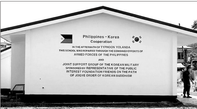
아름다운동행이 6월 17일 필리핀 팔로시에 완공한 파원초등학교