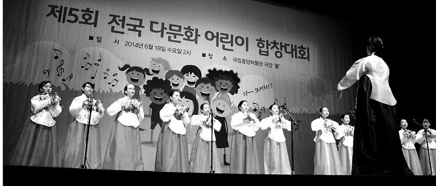
올해로 5회를 맞아 6월 18일 열린 전국다문화어린이합창대회는 화합과 어울림의 축제였다.