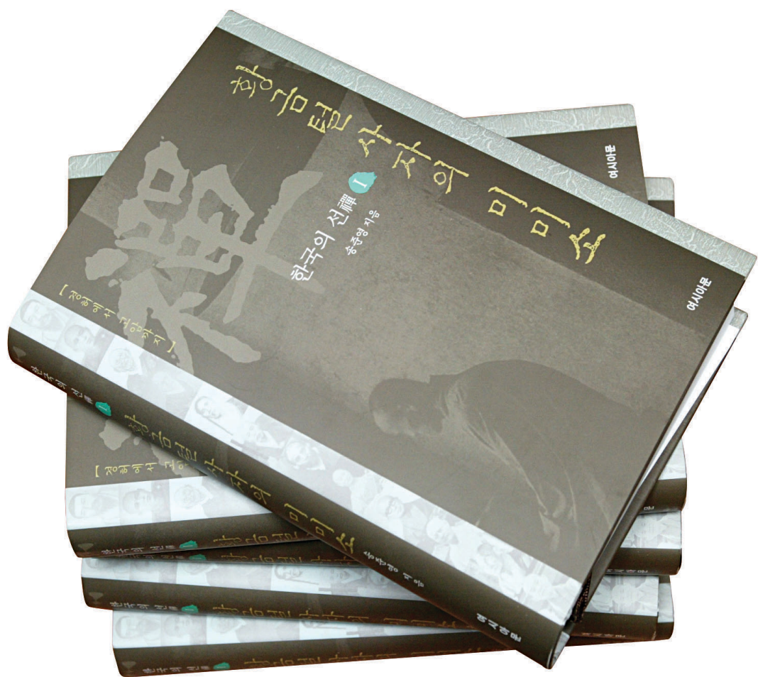
[송준영 지음 / 여시아문 펴냄 / 575쪽 / 25,000원]

선의 중흥조 경허 스님에서 고암 스님까지 12명 걸승들의 살림살이가 녹아든 선시의 '완전 이해'