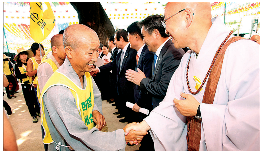
화쟁코리아 100일 순례 추진위원회는 6월 10일 조계사에서 '화쟁코리아 100일 순례 회향 및 대한민국 아단법석 시민위원회 선언식'을 개최했다. 사진은 순례단이 입장하고 있는 모습.

무엇보다 이날 가장 눈길을 끈 것은 '대한민국 아단법석 시민위원회' 선언이다. 화쟁코리아 100일 순례를 통해 확인된 갈등과 반목을 넘어서기 위해 만들어진 결과물이기 때문이다. 이날 참가자들은 선언문을 통해 "내 편만 옳다고 주장하는 양극단은 진실일 수 없다. 한쪽에서 치우친 극단을 벗어나야 한다"면서 "이제는 근원적이고 본질적인 진실의 길을 물어야 한다"고 밝혔다. 이어 "세월호 참사 오늘의 슬픔과 아픔을 잊지 않도록 하겠다. 철저하게 진실을 밝혀서 이를 토대로 안전한 사회, 생명이 우선인 사회로 전환될 수 있도록 국민적 노력을 지속해 가겠다"면서 "은 국민이 상주된 심정으로 천일기도, 천일 순례를 하는 마음으로 천신인 민심을 형성할 '대한민국 아단법석'을 펼쳐갈 것"이라고 다짐했다. 앞으로 활동 방향에 대해서는 "세월호 참사를 잊지 않고 희망을 만들어 갈 것" △