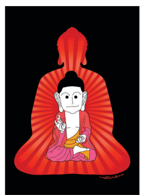
김동범 작가의 '신붓다'

전시 타이틀인 '붓다와 썸타요'는 요즘 한참 유행어인 '썸타다'라는 용어를 활용한 것으로 부처님의 말씀에 설레고, 붓다의 삶과 가까워지자는 의미를 담았다. 만만한 뉴스 발행인 지찬 스님은 "동국대 일산병원 전시에서 이어지는 릴레이 카툰전