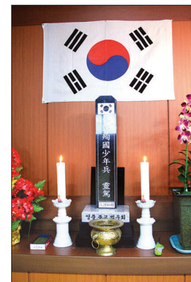
심우원 법당에 모셔진 태극기와 참전소년병 위패.

들었던 말인가? 뭐 이런 생각에 세상사는 게 결코 즐겁지 않았죠. 어렵게 살다보니 그럴 수밖에 없었던 것 같아요. 그런데 어느 때부터 불교 책을 조금씩 보게 되었는데, 무슨 책이었던지 기억은 없지만 그 책들이 내 생각의 방향을 조금씩 돌려주었어요. 그 원망과 한이 부모 탓은 아닐 것이라 생각했죠. 어떤 부모가 일부러 자식에게 가난과 무식을 물려주겠는가 말입니다. 또 하늘의 뜻인가? 하는 의문에도 아니라는 생각이 앞섰어요. 그렇게 생각을 굴