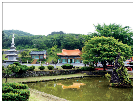
조계종 제23교구 본사인 관음사 전경.

특히 할아버지가 관음사 초대 신도회장을 역임한 강금실 前 법무부 장관은 마음이 복잡할 때면 제주를 찾는데, 그때마다 이 곳 관음사를 참배한다고 한다.