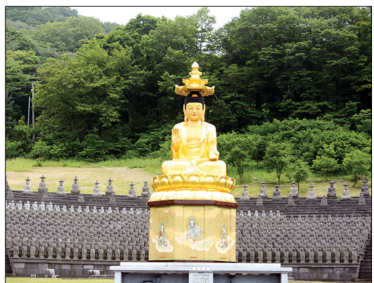
공원 형식으로 조성된 관음사 미륵대불.