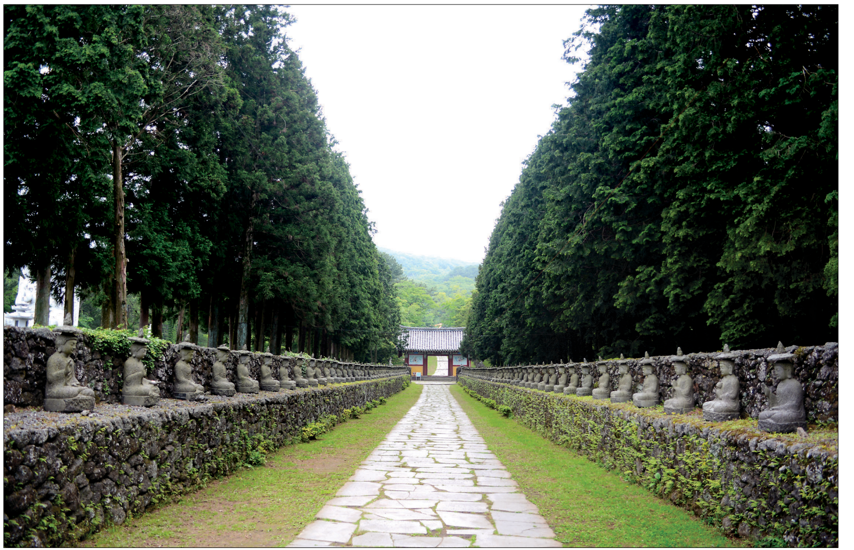
일주문서 사천왕문에 이르는 삼나무 숲길은 투박하지만 정감이 있다. 양쪽에 도열된 현무암 부처님들은 이국적인 정취를 자아낸다.