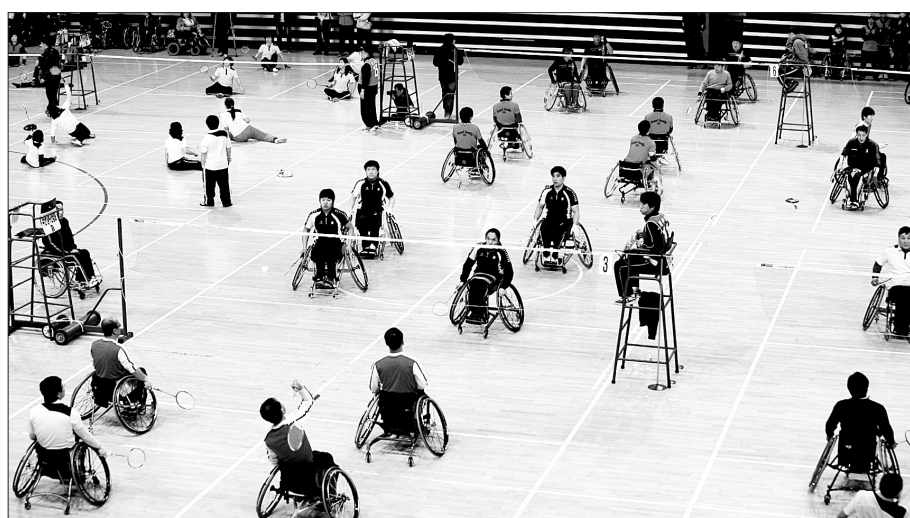
전국 장애인 배드민턴대회 모습. 특별한 기술이 필요하지 않고 누구나 즐길 수 있는 배드민턴은 발달장애인들이 가장 접하기 쉽고 선호하는 종목이다.