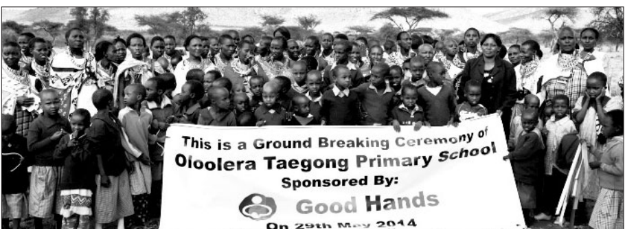
지난 5월 29일, 케냐 올로레라 태공초등학교 기공식에 참석한 관계자들이 성공적인 학교 건립을 기원하며 기념사진을 찍고 있다.

지구촌공생회 역할은 학교 건립에서만 끝나지 않는다. 학교 스스로 자립할 수 있